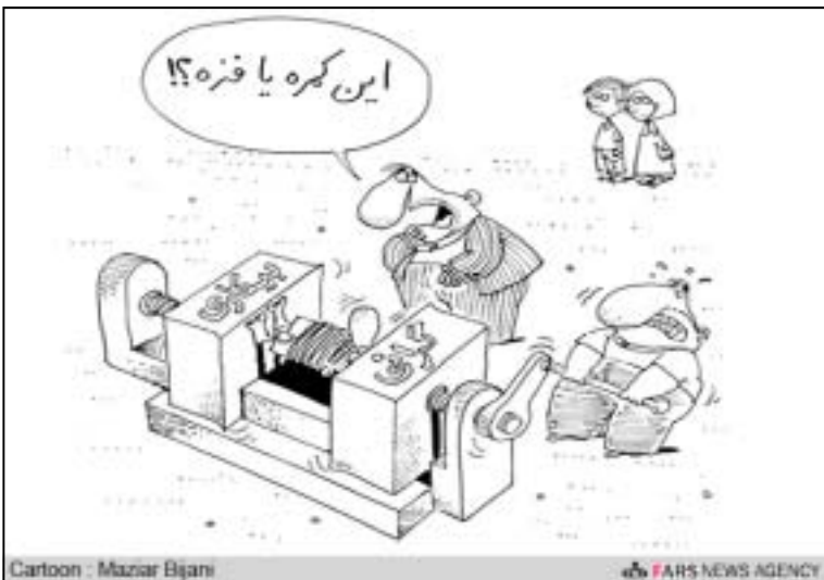
Cartoon - Mazar Bijani

منم محموت، پسر موت بزرگ که ده ملیون سال پیش میزیست. آنگاه که بدون جنگ و پیکار به ریاست جمهوری برآمدم همه مردم مرا با شادمانی پذیرفتند. گیرم که با اسلحه و توپ و آریبجی و هزاران کشته و زخمی. من برق مردم را قطع کردم و به جایش هاله‌ی نور آوردم که هم خفن تر است، هم پر نورتر و هم کم مصرف. من جاده تورم را کنترل کردم و آن را به عرش خدا رساندم تا راه‌های رسیدن به خدا را توسعه دهم. فرمان دادم که پول نفت را بر سر سفره‌ها برند. سفره‌های گینه و توگو و کنیا و زیمباوه و حماس و حزب‌الله... من بنزین را سهمیه‌بندی کردم و طبق قولم، با پول آن ده هزار مدرسه و چهل هزار بیمارستان ساختم. فرمان دادم: مگر مشکل ما موی جوان‌های ماست که بعدها کلمه‌ی «مگر» از نسخه پاک شد. «باشد که بعدها از من به نیکی یاد کنید» «حالا نیکی هم نشد به خوبی یاد کنید» «دیگر چانه نزنید، حداقل فحش ندهید»